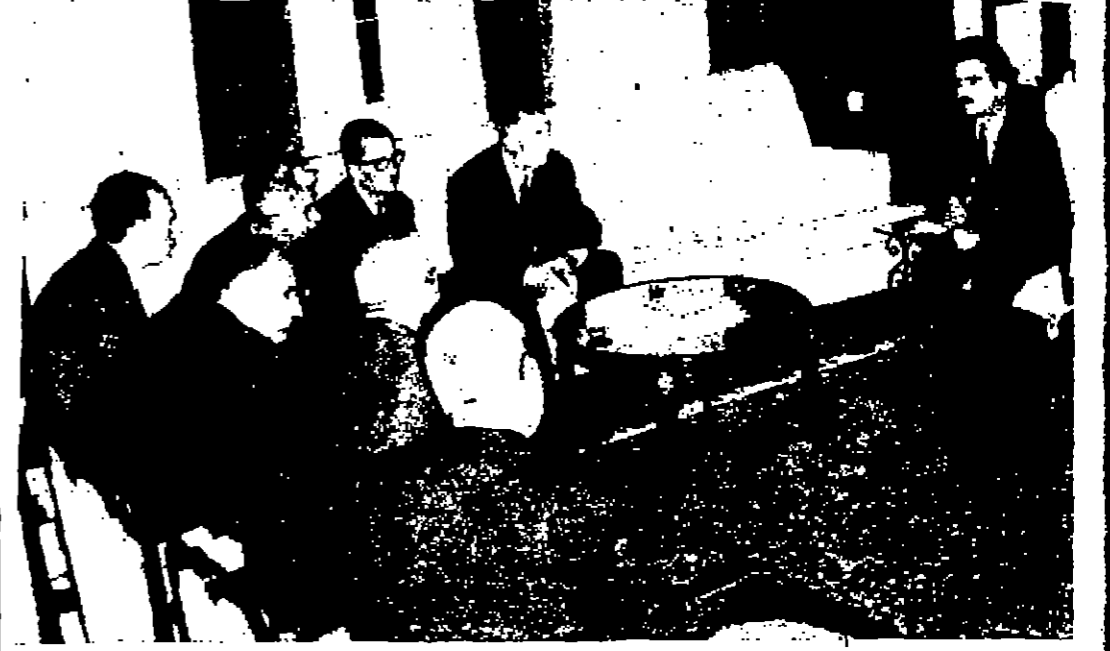
سوا البحر حسن ولي المهدي نائب جلالة الملك المعظم يتحدث الى اعضاء الوفد البلغاري لدى نشرهم بمقابلة سموه اميس

عمان - استقبل السيد بهجت القاهوني رئيس الوزراء في مكتبه صباح أمس الوفد البرلماني البلغاري برئاسة السيد كيريل لزاروف رئيس مجلس الاتحاد الوطني البلغاري كلمة رئيس الوزراء وقد رحب الرئيس القاهوني بالوفد المضيف وقال: اننا نقدر لبلغارنا مؤتمرا من قضاةنا وتلميذنا المستور لنا في الحفل الدولية اراء قضائنا الذين الوسط، وخاصة قضية فلسطين. البقية على الصفحة السادسة عمود ٥